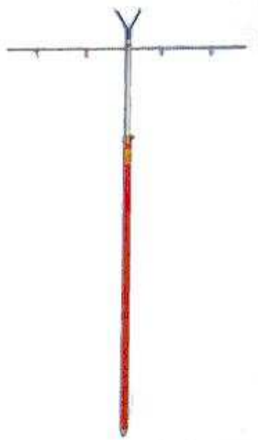
Percha o “ T “ para poder hacer el “cambio rápido”.

Un truquito que va muy bien para saber donde hemos lanzado es cada vez que veamos una picada, al recoger contemos las vueltas de nuestro carrete... sabiendo la longitud de línea que recoge nuestro carrete, sabremos a los metros que estaba nuestro aparejo lanzado, así nos será mucho mas fácil saber donde tenemos que lanzar.